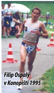
Filip Ospalý v Konopišti 1995

V České republice se za 40 let triatlonu, zrodila řada úspěšných triatlonistů/tek, kteří dosáhli na úspěchy na evropských a světových šampionátech. Určitě mnozí mají v paměti premiéru triatlonu na olympiádě a bronz Jana Řehuly. A kdo by třeba neznal nezničitelného Ironmana Petra Vabrouška. Ale co se týká počtu TOP úspěchů, tak určitě v historii českého triatlonu vyčnívá Filip Ospalý. Jeho prvenství na ME v Karlových Varech bylo opravdu legendární. A k tomuto titulu přidal i tři další - v týmech, duatlonu a středním triatlonu. V tom se navíc stal vícemistrem světa. Tříkrát se postavil na start na olympiádě a 10x se stal mistrem ČR v krátkém triatlonu. Zkusil i pověstného Ironmana a hned při premiéře ho dal pod neskutečných 8 hodin. Na tento čas trénují mnozí specialisté a mnohdy se k tomuto času vůbec nepřiblíží. Pro laiky jde o tratě 3,8 km plavání – 180 km na kole – 42 km běhu. Co k tomu dodat. Snad jen klobouk dolů a velká gratulace.